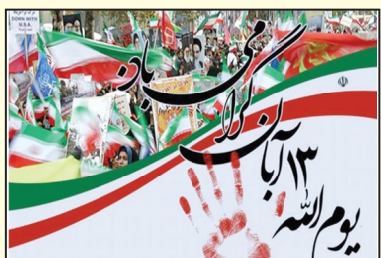
دانش افزایی پرچم استبداد و استکبار ستیزی را بر افراشته نگاه دارند.

این تجربه گران سنگ استبداد و استکبار ستیزی، تکلیف سنگینی بر دوش اصحاب علم و دانش و دانشگاهیان و دانش آموزان ایران اسلامی می نهد و بر ما واجب می سازد که با تکیه بر تعهد، کسب تخصص و دانش برخاسته از ایمان، مسیر مقدس امام راحل و شهدای راه استقلال و آزادی را ادامه دهیم. اینجانب روز دانش آموز را به همه دانش